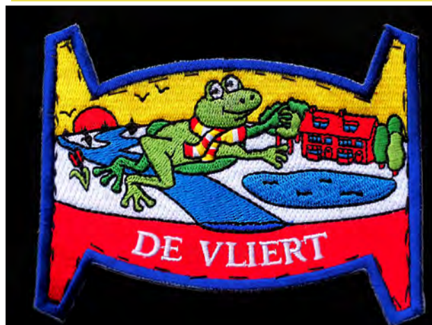
Embleem op jasje geborduurd

Heb jij ook interesse in een embleem? Het kost € 5. Stuur een email met je naam, straat, huisnummer en het aantal emblemen naar: devliertembleem@gmail.com